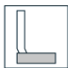
Stående hålkäl 10 x 20 med hörn