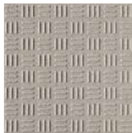
Line R12 / A+B+C / V8