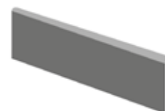
Sockel 10 x 20, 10 x 30