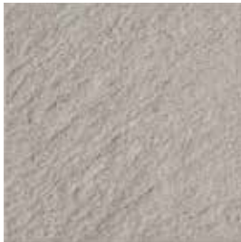
Roccia R11 / A+B+C / V4