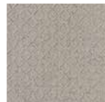
Point R12 / A+B+C / V4