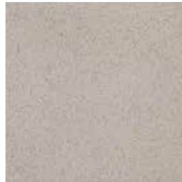
SLR R12 / A+B+C