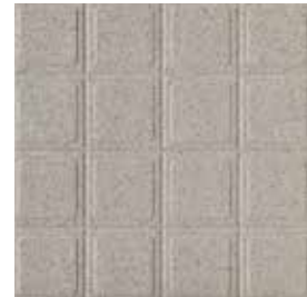
Quadri R11 / A+B+C / V4