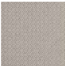
Star R12 / A+B+C / V4